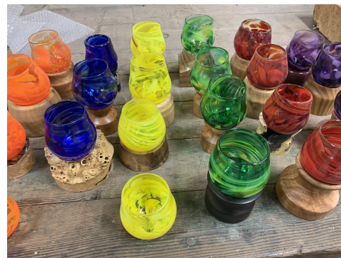
Los trofeos de los Premios 2020 en su fase de creación

2. Recibirá un correo electrónico o un mensaje de texto de confirmación de la nominación recibida. La persona o grupo nominado será contactado sobre su reconocimiento y deberá confirmar su interés en participar y los siguientes pasos del proceso de premiación.